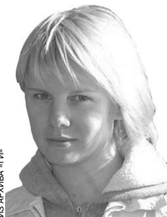
Руководитель отдела персонала Филиала в СПб Швейцарского транспортного холдинга.

Конечно, все это гипотетические страшилки. Проект слишком расплывчат. Кроме закона должны быть еще приняты и подзаконные акты, в которых будет конкретика. Кроме того, любой, даже самый прекрасный закон проверяется практикой его применения. Живой пример в той же области образования – о ЕГЭ. Как бы его не ругали, я считаю, что идея правильная (с оговоркой – не для гуманитарных предметов). Обезличенная, безлюбимчиков и натяжная оценка действительных знаний. Однако практика его применения в насковзь коррупцированной стране привела лишь к всплеску гениальности в южных республиках.