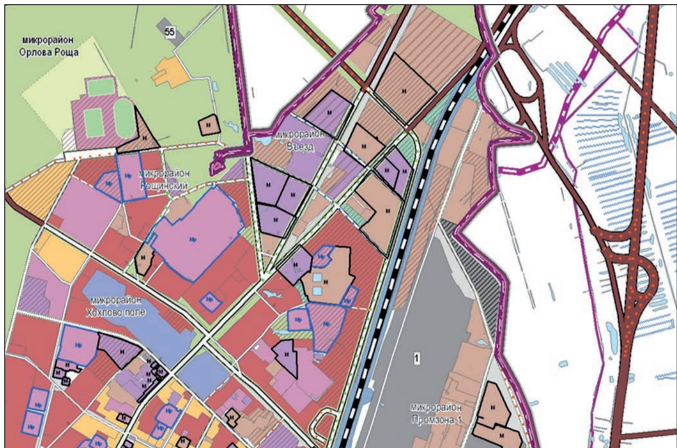
Материал читайте на 2-й стр.