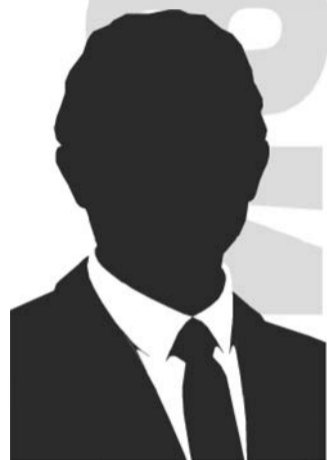
Преподаватель философии и логики.

В общем, у меня много вопросов к новому закону об образовании, но совсем других. В этой статье я при всей своей взыскательности ничего страшного не нашла.