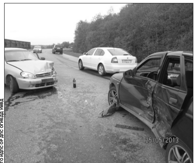
ФОТО ИЛДС ОР ДПС ОГИБДД УМВД

В тот же день в 19.30 на 4-м километре автодороги Гатчина — Ополье (деревня Парницы) водитель (мужчина 1954 г.р.), управляя скутером, не справившись с управлением, съехал кювет. В результате ДТП водитель с закрытой черепно-мозговой травмой, сотрясением головного мозга и пассажир (мужчина 1958